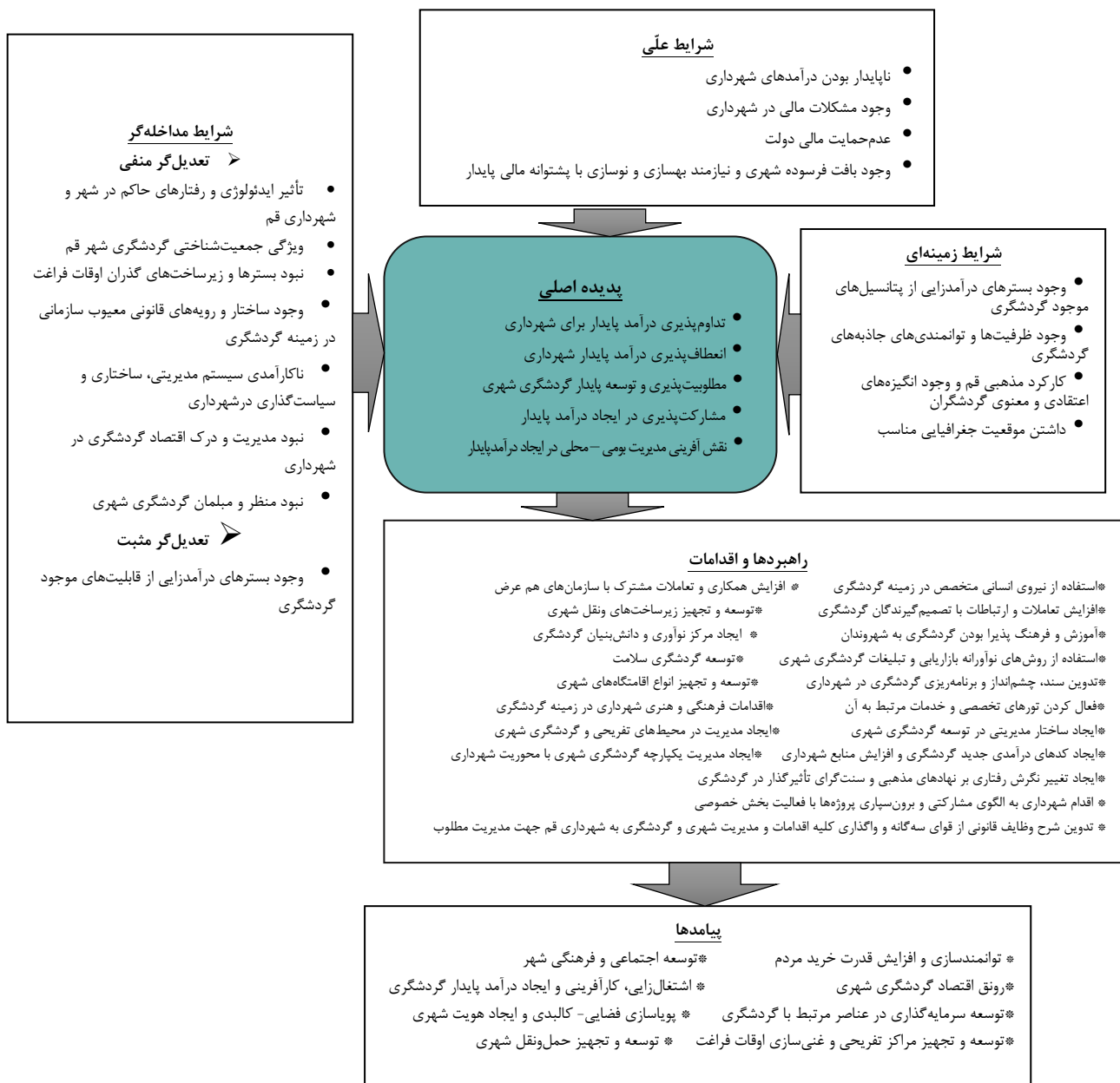
شکل ۲- الگوی مفهومی درآمد پایدار شهرداری قم مبتنی بر گردشگری

۳- مشاهده بلندمدت در بازدید از محل تحقیق یا مشاهدات تکراری پدیده مشابه: بدین منظور داده‌ها از اول