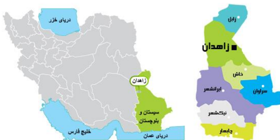
موقعیت استان سیستان و بلوچستان در ایران

نقشه ۱- موقعیت شهر زاهدان در شهرستان زاهدان، استان سیستان و بلوچستان و ایران